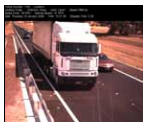
Zdjęcie miejsca kontroli

Redflex opracował własny system oświetlenia błyskowego dedykowany dla urządzeń kontroli ruchu drogowego.