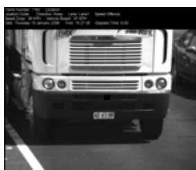
Zdjęcie tablicy rejestracyjnej